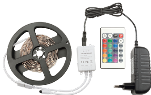
Комплект ленты RGB