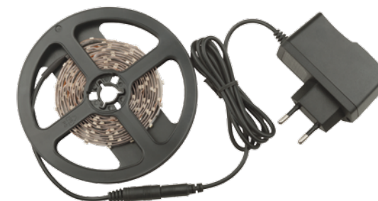
Комплект ленты белого свечения